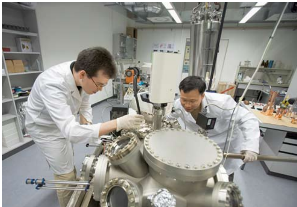
Die Attraktivität des Bildungs- und Hochschulplatzes Schweiz zu erhalten und weiter zu fördern ist unerlässlich: Förderung der Qualität der Lehre und Forschung, von guten Arbeitsbedingungen an den Hochschulen und einer guten Bildungsinfrastruktur. Bild: Eidg. Materialprüfungs- und Forschungsanstalt (Empa). Sie ist Teil des ETH Bereichs.

1 Staatssekretariat für Bildung und Forschung (SBF) (2010): MINT Fachkräftemangel, Bern.